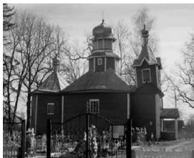
Рисунок 1 – Общий вид здания прихода храма Успения Пресвятой Богородицы в д. Кошевичи Петриковского района и фрагменты деревянных конструкций (нижних венцов и междуэтажного перекрытия крестильни), поврежденных дереворазрушающими грибами