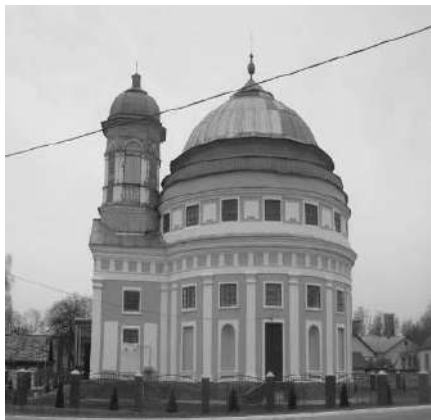
Рисунок 3 – Общий вид здания прихода храма Преображения Господня в г. Чечерск и фрагменты деревянных конструкций барабана и его обшивки, поврежденных дереворазрушающими грибами