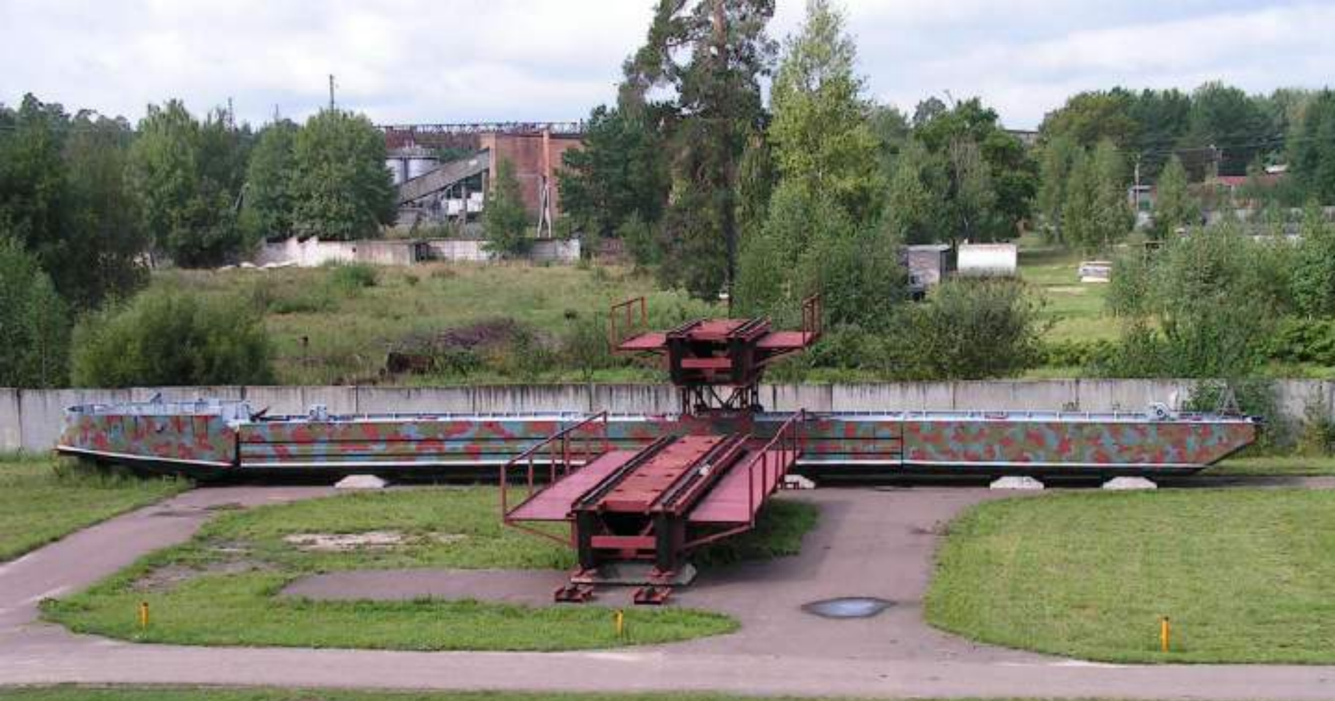
НАПЛАВНОЙ ЖЕЛЕЗНОДОРОЖНЫЙ МОСТ (НЖМ-56)