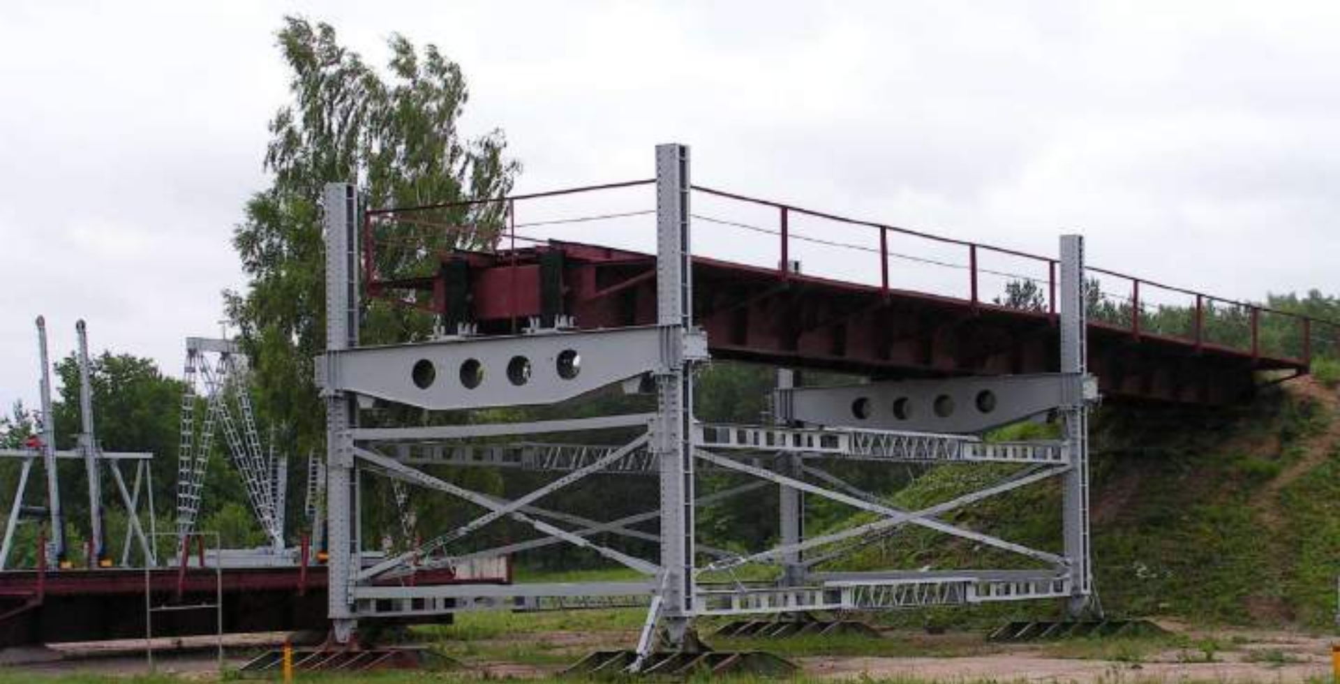
Рамная эстакада металлическая (РЭМ-500)