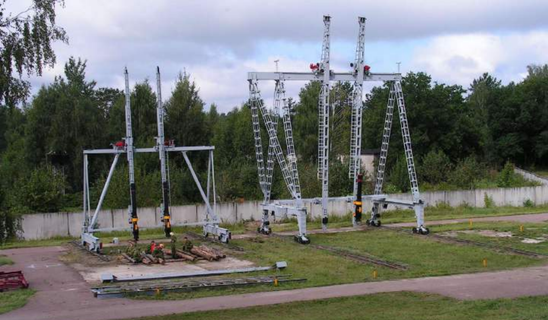
Портальный копер-кран (ПКК 2x1250)